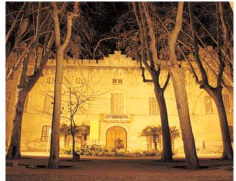
Palau de Can Mercader. Ajuntament de Cornellà

En aquesta zona destaquen tres elements: el palau pròpiament dit, els jardins i els plàtans que flanquegen el passeig. Aquest, en la seva part central, s'obre per acollir i envoltar jardins i palau. És aquí on es conserven encara elements de l'antiga estructura de camins i terrasses de la finca i es guarden gelosament alguns dels secrets més íntims de Can Mercader.