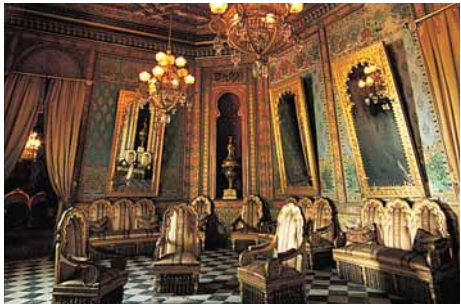
Interiors del palau. Ajuntament de Cornellà

Com que la família havia deixat la seva residència al Passeig de Gràcia de Barcelona per instal·lar-se definitivament a Cornellà, el trasllat inclogué les col·leccions privades d'armes, ceràmiques, vestits, animals dissecats, fòssils, nius d'ocells i altres objectes que formaven el "Museu del Comte de Bell-lloc". Entre els anys 1990 i 2004, el palau ha estat objecte de successives fases de rehabilitació, que van permetre que ja el 1995, s'obris al públic com a museu d'arts plàstiques i decoratives i com a seu d'actes culturals i de casaments civils.